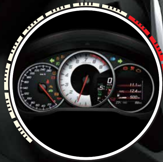
DISPLAY DE INFORMACIÓN MÚLTIPLE TFT 4,2" (2)