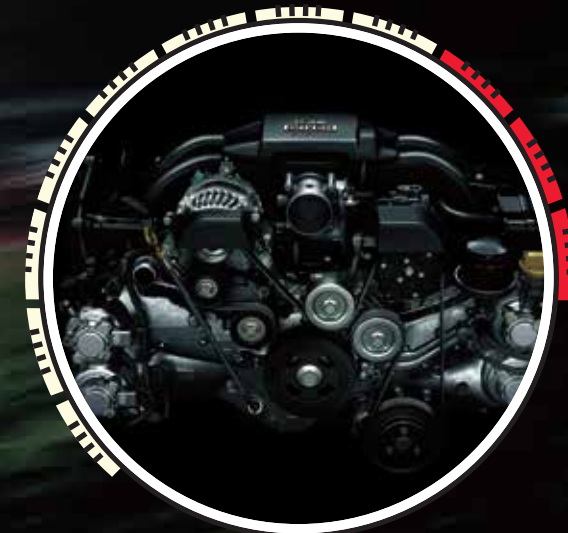
MOTOR: Tipo Boxer con inyección D4-S directa e indirecta y 4 cilindros horizontalmente opuestos, favorece su bajo centro de gravedad.