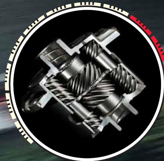
DIFERENCIAL TORSEN LSD: Otorga una respuesta efectiva, estabilidad en las curvas y un mayor agarre, ya que transfiere parte de la fuerza del motor a los neumáticos.

La adrenalina de subirse al Toyota 86 no sólo se siente a máxima velocidad. La emoción de manejarlo se vive en cualquier circunstancia de su desempeño, y siempre en su mayor expresión. Y eso es gracias a su bajo centro de gravedad, reducido peso, diseño aerodinámico, tracción trasera y motor Boxer delantero 2.0 litros alimentado mediante la tecnología D4-S con sistema de inyección directa e indirecta. Subirte a un Toyota 86, es subirte a un vehículo con tu misma pasión.