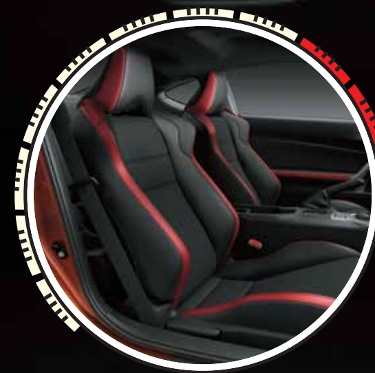
BUTACAS DEPORTIVAS TAPIZADAS EN CUERO NEGRO CON DETALLES EN COLOR ROJO (2)

Al interior del Toyota 86 también vale la pena recorrerlo, porque despierta la pasión en cada detalle. Su diseño es atractivo, funcional y tecnológico. Cuenta con Audio Navegador (GPS) con pantalla táctil inteligente de 7" que reconoce gestos dactilares, Bluetooth® con manos libres, reproductor de DVD, entrada USB, tarjeta SD, conectividad con dispositivos iOS y Android y capacidad de reproducir múltiples formatos. Por otro lado, el volante ergonómico ofrece un agarre seguro y control absoluto, mientras que las butacas deportivas dan una sujeción lateral perfecta para las curvas pronunciadas. Su pedalera de aluminio, controles centrales y palanca de cambios de corto recorrido, completan la experiencia inolvidable de manejar el Toyota 86.